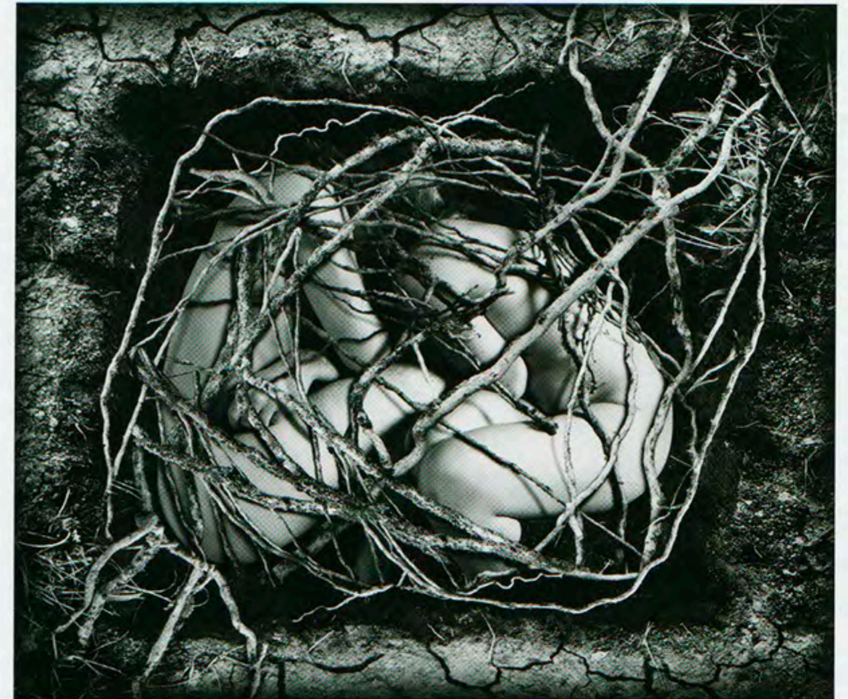
Louve Delfieu Page de gauche : Françoise Pesslherbe

Une photographie non consumériste, non stéréotypée, non documentaire, non évidente. Hors des conventions photographiques.